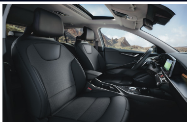
GOLD / PLATINUM fekete műbőr-szövetcárpit (sztenderd)