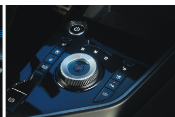
Menetirány előválasztó tárcsa