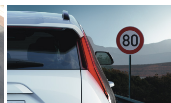
Sebességkorlátozást kijelző rendszer (SLIF)