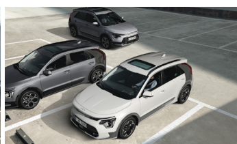
Parkolásiütközés-elkerülő asszisztens (PCA)