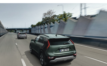
Navigációalapú adaptív tempomat Stop&Go funkcióval (NSCC)