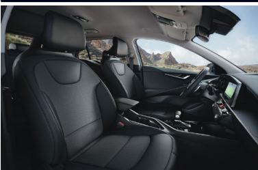
SILVER fekete szövetcárpit (sztenderd)