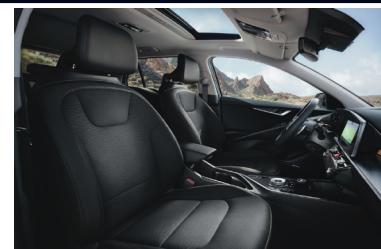
KRYPTONITE fekete vegánbőr kárpit (sztenderd választható)