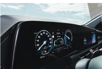
Fulldigitális műszeregység 10.25"