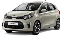
Milky Beige (M9Y)