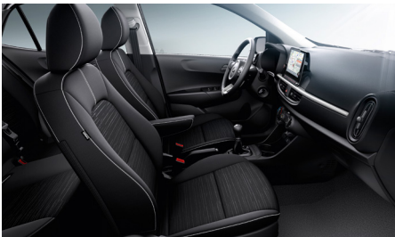
SILVER fekete szövet