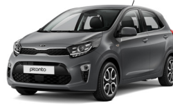
Astro Grey (M7G)