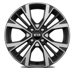
GT LINE 16" könnyűfém keréktárcsa