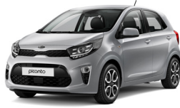
Sparkling Silver (KCS)