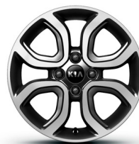
PLATINUM 15" könnyűfém keréktárcsa