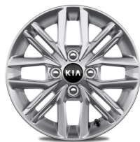
GOLD 14" könnyűfém keréktárcsa