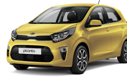
Honey Bee (B2Y)