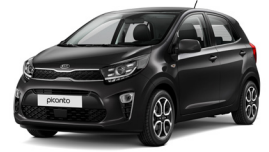
Aurora Black Pearl (ABP)