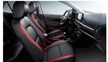
GT LINE szintetikus bőr/szövet piros