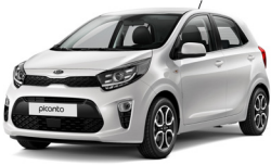
Clear White (UD)