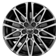
GT könnyűfém keréktárcsa 18"

* A finanszírozási ajánlat Kia ProCeed modellre vonatkozik. Kia Finanszírozás 9,48% évi üzleti kamattal és 9,90% THM-el, fix kamatozású zártvégű pénzügyi lízinggel, 9 549 000 Ft bruttó vétellel, 4 936 833 Ft finanszírozott tőke összeggel és 48 hónapos futamidővel havi 123 985 Ft bruttó lízingdíjjal érvényes. A teljes visszafizetendő összeg 5 951 291 Ft.