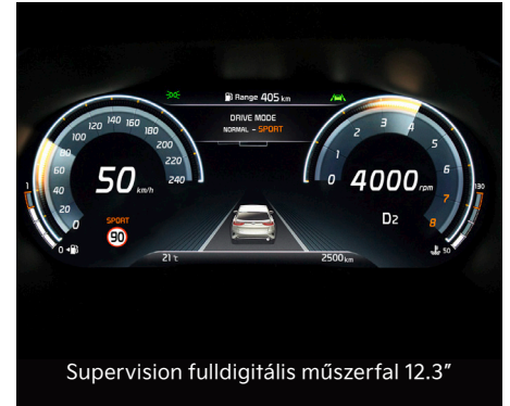
Supervision fulldigitális műszerfal 12.3"