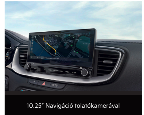
10.25" Navigáció tolatókamerával