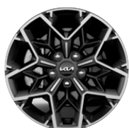
GT LINE könnyűfém keréktárcsa 17"