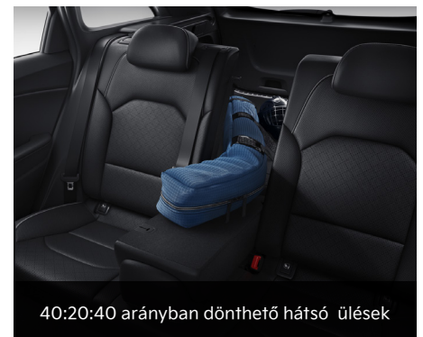
40:20:40 arányban dönthető hátsó ülések