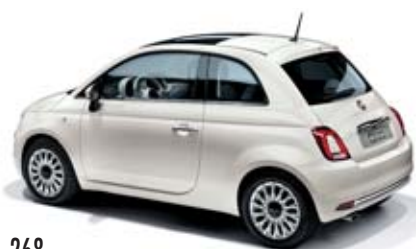
268 GELATO FEHÉR