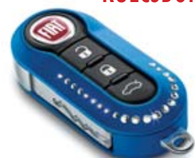
Swarovski - Kígyó minta