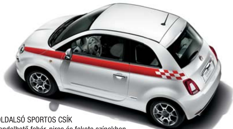
OLDALSÓ SPORTOS CSÍK rendelhető fehér, piros és fekete színekben