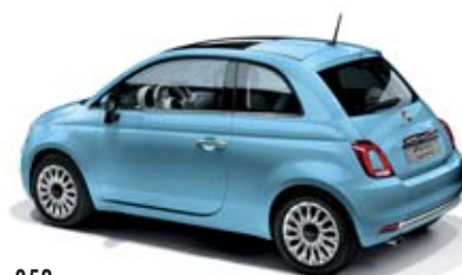
952 VOLARE KÉK