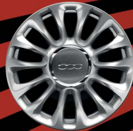
6U4 - 15"-OS FÉNYES EZÜST könnyűfém keréktárcsák