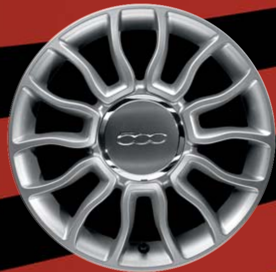
4WQ - 15"-OS FÉNYES EZÜST könnyűfém keréktárcsák