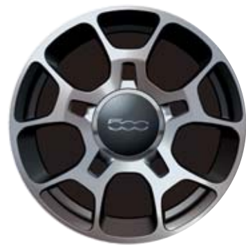
5 küllős gyémántfényű sportos kivitel