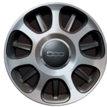
7 küllős gyémántfényű