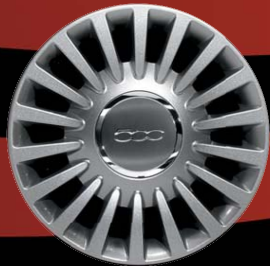
431 - 15"-OS FÉNYES EZÜST könnyűfém keréktárcsák