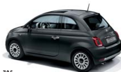
735 CARRARA SZÜRKE