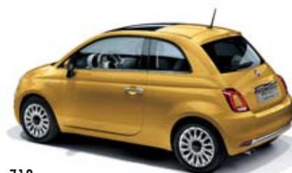
712 SOLE SÁRGA