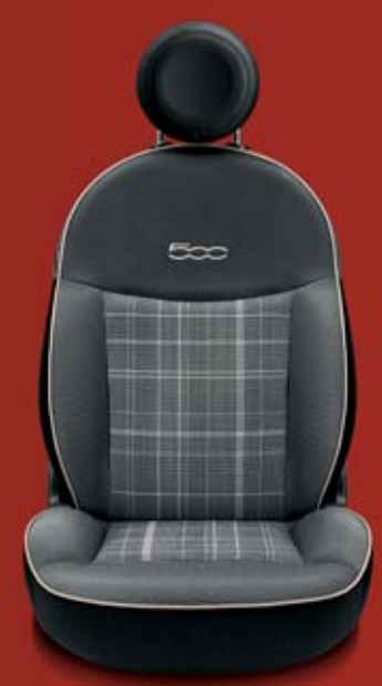
LOUNGE 301 Prince of Wales kockás szövetkárpit elefántcsontszín mintázattal (középen) csíkos szövetkárpit elefántcsontszín szegéllyel. Fejtámla és a háttámla felső része fekete műbőr. Kontrasztos, himzett elefántcsontszín logóval.