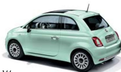
166 LATTEMENTA ZÖLD