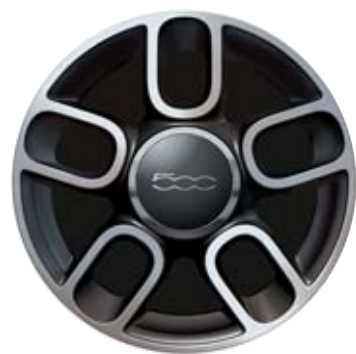
5 küllős bikolor sportos kivitel