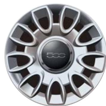
9 dupla küllős