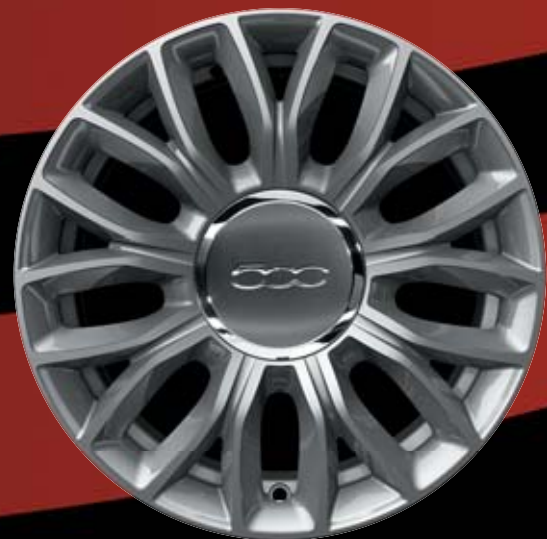
73Z - 15"-OS FÉNYES EZÜST könnyűfém keréktárcsák