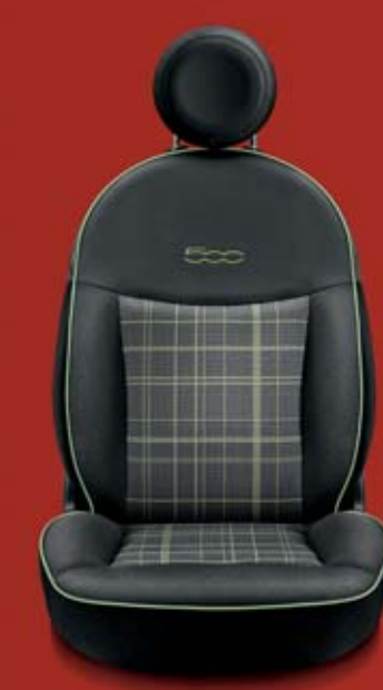
LOUNGE 302 Prince of Wales kockás szövetkárpit oliva zöld mintázattal (középen), csíkos szövetkárpit oliva zöld szegéllyel. Fejtámla és a háttámla felső része fekete műbőr. Kontrasztos, himzett, oliva zöld logóval.