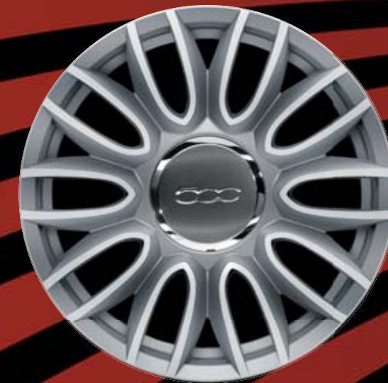
74A - 16"-OS KÖZÉPSZÜRKE GYÉMÁNTFÉNYŰ könnyűfém keréktárcsák