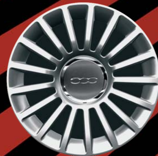
435 - 16"-OS FÉNYES EZÜST könnyűfém keréktárcsák