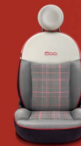
LOUNGE 605 Prince of Wales kockás szövetkárpit korallszín mintázattal (középen) csíkos szövetkárpit korallszín szegéllyel. Fejtámla és a háttámla felső része elefántcsontszín műbőr. Kontrasztos, himzett korallszín logóval.