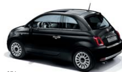
876 VESUVIO FEKETE