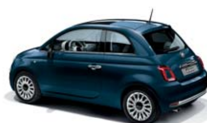
687 DIPINTO DI BLU KÉK