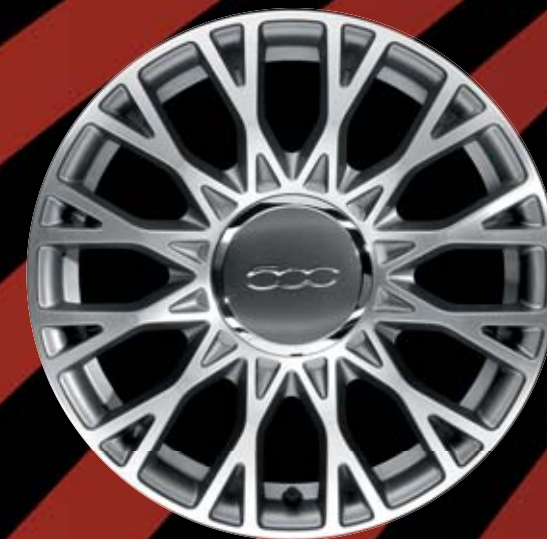
5EQ - 16"-OS FÉNYES EZÜST könnyűfém keréktárcsák