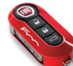
Korallszín és chevron mintás készlet