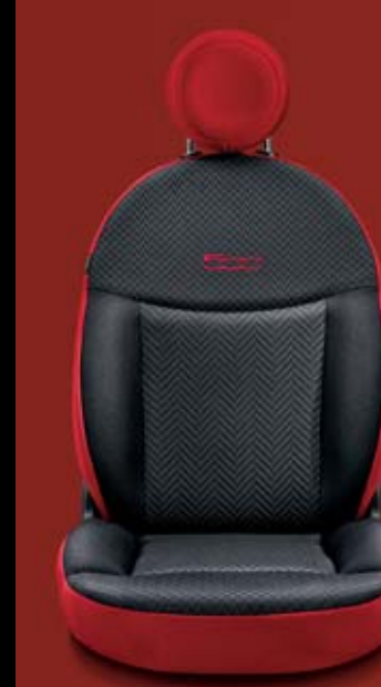
POP 241/273 Chevron kéttónusú szövetkárpit sötétszürke (ülés háttámla) oldalai és fejtámlája piros szövetből. 500 logó piros thermo nyomással.