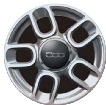
5 küllős bikolor sportos kivitel