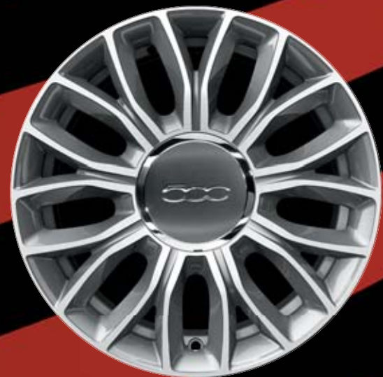
5YN - 15"-OS SZÜRKE GYÉMÁNTFÉNYŰ könnyűfém keréktárcsák