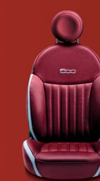
POP - LOUNGE (OPCIÓ) 688 Burgundy Frau bőrkárpit elefántcsontszín betétekkel. Burgundy bőr fejtámla kontrasztos, himzett kék 500-as logóval.