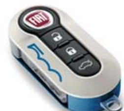
Kék-fehér Italy készlet - zöld-fehér Military készlet