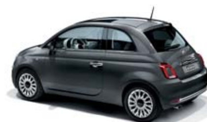
695 POMPEI SZÜRKE