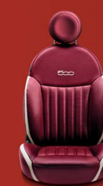
POP - LOUNGE (OPCIÓ) 861 Burgundy Frau bőrkárpit elefántcsontszín betétekkel. Burgundy bőr fejtámla kontrasztos, himzett elefántcsontszín 500-as logóval.