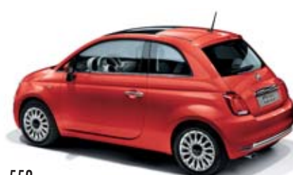
552 KORALL PIROS