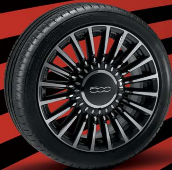
5ZZ - 16"-OS MATT FEKETE GYÉMÁNTFÉNYŰ könnyűfém keréktárcsák