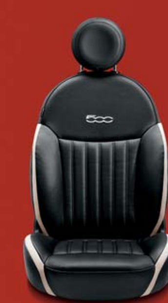
POP - LOUNGE (OPCIÓ) 686/687 Fekete Frau bőrkárpit elefántcsontszín betétekkel. Burgundy fekete színű bőr fejtámla kontrasztos, himzett elefántcsontszín 500-as logóval.