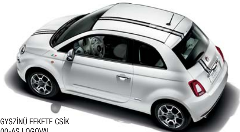
EGYSZÍNŰ FEKETE CSÍK 500-AS LOGOVAL