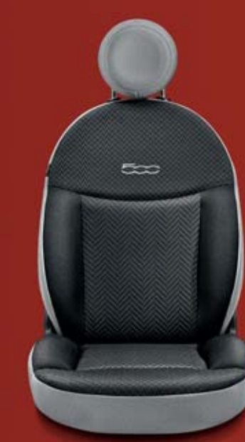
POP 243/359 Chevron kéttónusú szövetkárpit sötétszürke (ülés háttámla) oldalai és fejtámlája szürke szövetből. 500 logó szürke thermo nyomással.