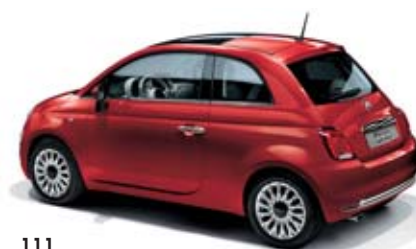
111 PASSIONE PIROS