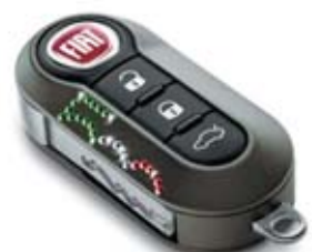
Swarovski - 500-as minta