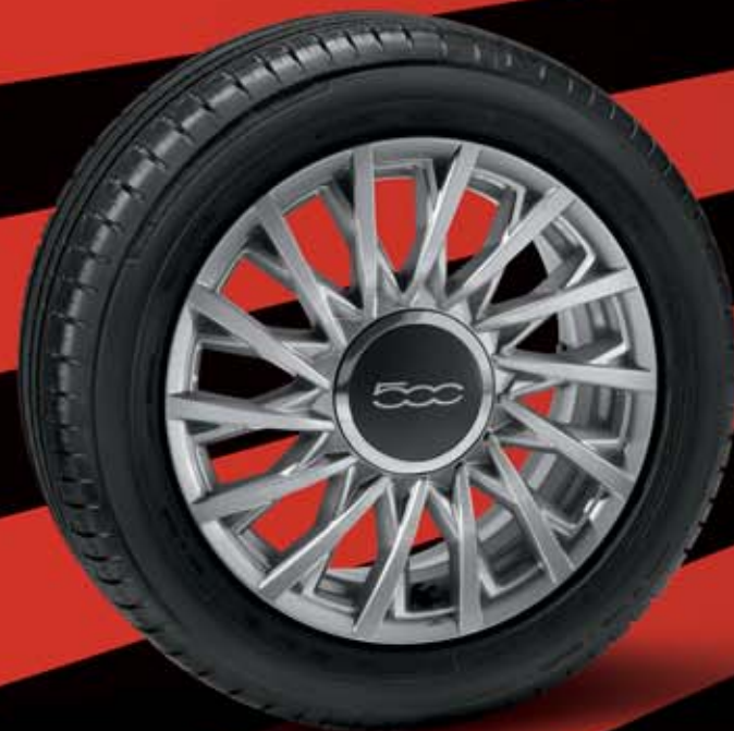
74B - 15"-OS FÉNYES EZÜST könnyűfém keréktárcsák