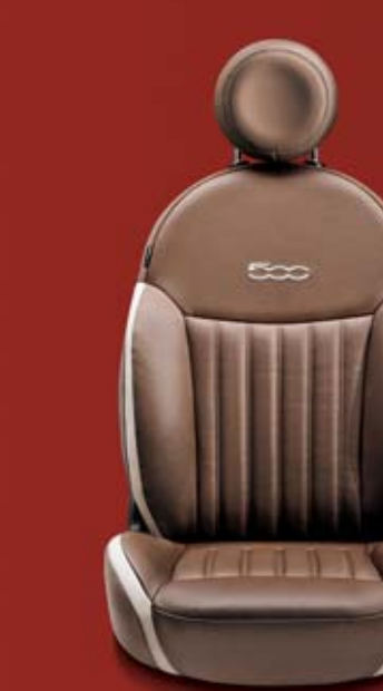
POP - LOUNGE (OPCIÓ) 461 Dohányszín Frau bőrkárpit elefántcsontszín betétekkel. Dohányszín bőr fejtámla kontrasztos, himzett elefántcsontszín 500-as logóval.