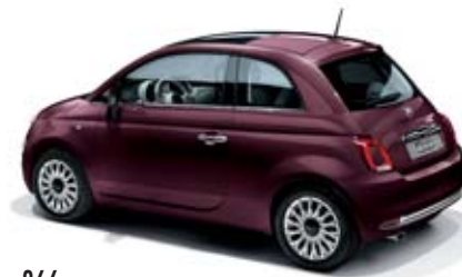
866 BURGUNDY OPERA LILA