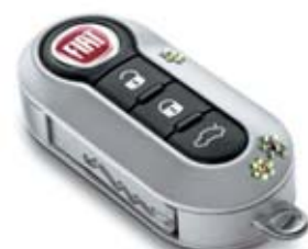
Swarovski - Virág minta