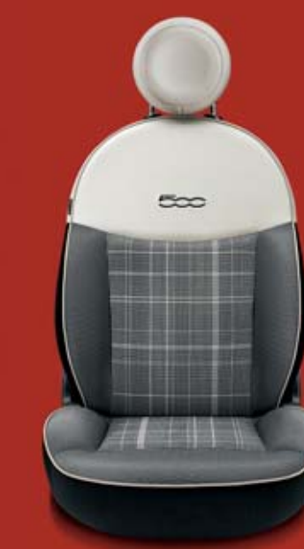
LOUNGE 374 Prince of Wales kockás szövetkárpit mintázattal (középen) csíkos szövetkárpit elefántcsontszín szegéllyel. Fejtámla és a háttámla felső része elefántcsontszín műbőr. Kontrasztos, himzett elefántcsontszín logóval.