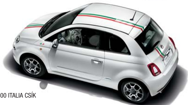
500 ITALIA CSÍK