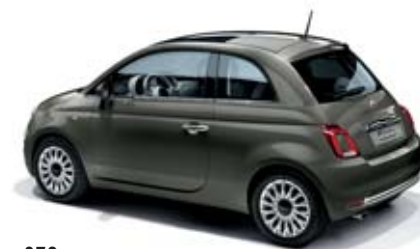
372 COLOSSEO SZÜRKE