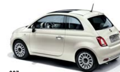
227 GHIACCIO FEHÉR