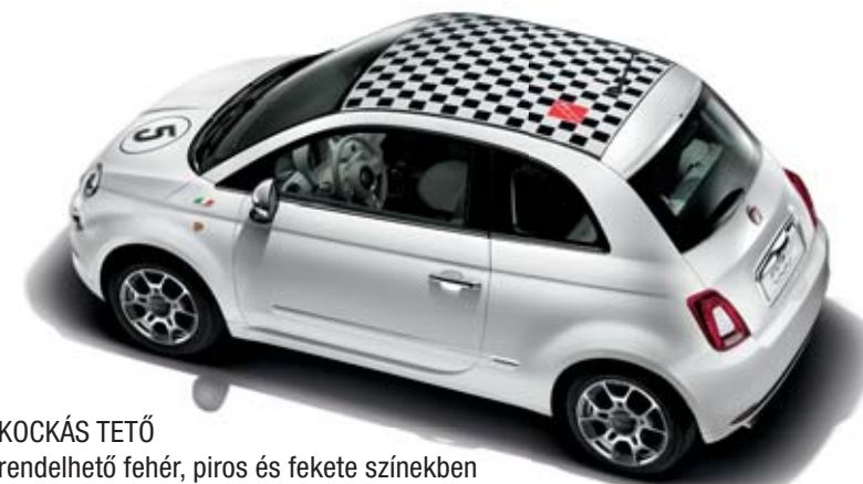
KOCKÁS TETŐ rendelhető fehér, piros és fekete színekben

Matricák, kulcsborítások, logók, sminktartók, iPod-tartók, keréktárcsák: akik kreativitásukat szeretnék kifejezni mindent megtalálnak ahhoz, hogy saját ízlésük szerint tovább alakítsák ezt a valódi design tárgyat és igazi egyedi darabot hozzanak létre.