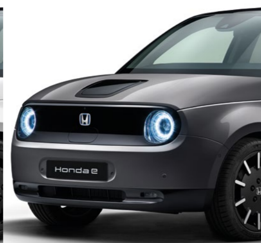
MODERN STEEL METALLIC