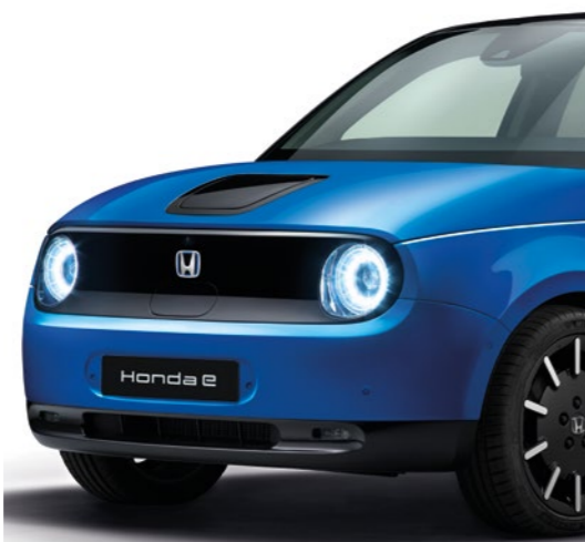
PREMIUM CRYSTAL BLUE METALLIC