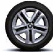
16" COMPLEA dísztárcsa