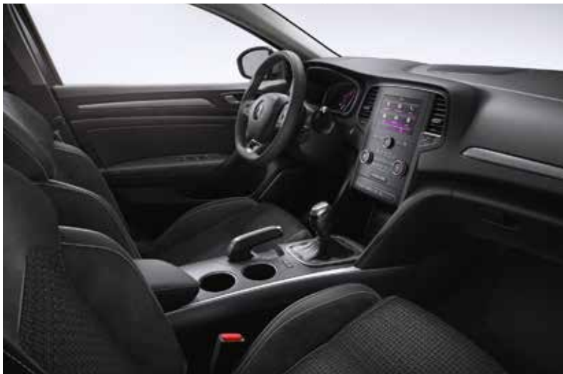
Intens felszereltség, opciós R-LINK 2 ® -vel, 7"-os kijelzővel