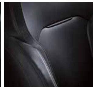
Bőr-műbőr kárpitozás (opció)