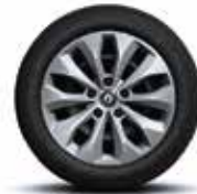
16" FLORIDA díztárcsa