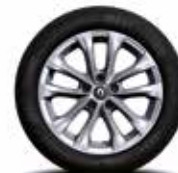
17" EXCEPTION alufelni (opció)