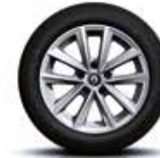
16" SILVERLINE alufelni (opció)