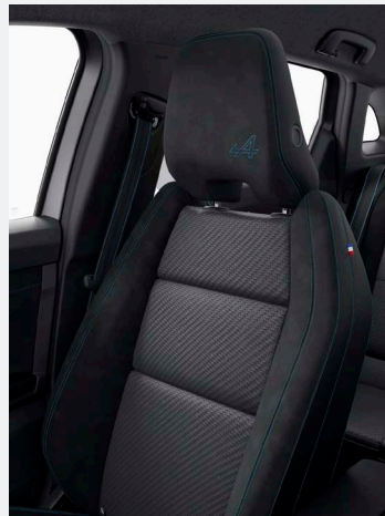
techno esprit Alpine (szériafelszereltség)

sötét Alcantara bőr betétes szövet üléskárpit Alpine kék varrásokkal