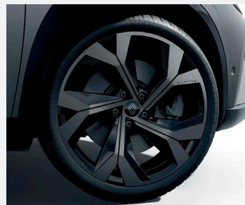
techno esprit Alpine (szériafelszereltség)

20" könnyűfém keréktárcsa DAYTONA keréktárcsa dizájn